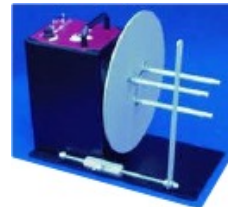
MC-11 mit Option Materialführung MC-10-APG